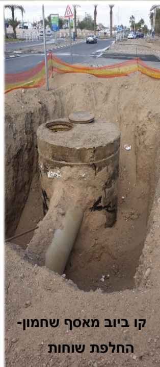
קו ביוב מאסף שחמון- החלפת שוחות