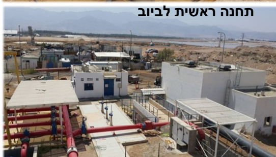
תחנה ראשית לביוב