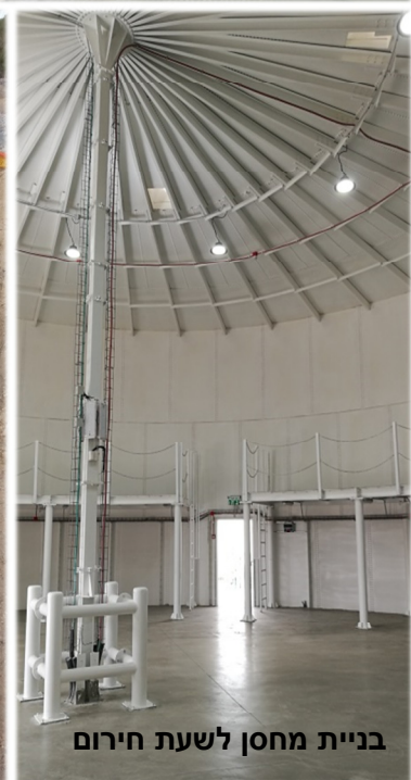
בניית מחסן לשעת חירום