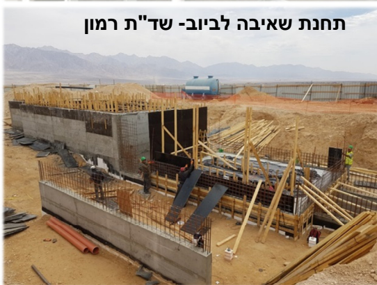
תחנת שאיבה לביוב- שד"ת רמון